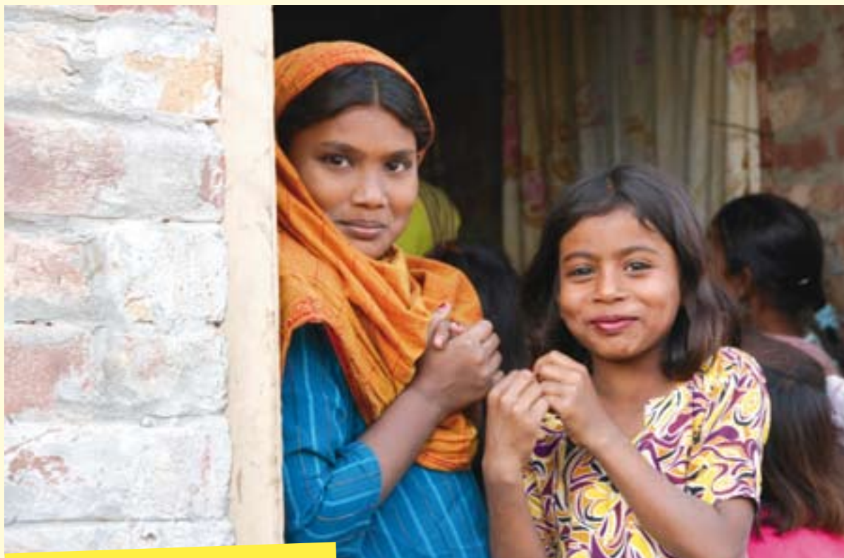
Meisjes van de steenfabriek in Pakistan