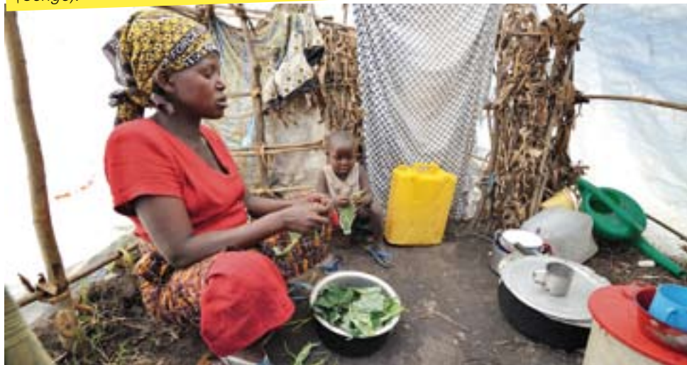
Moeder en dochter bereiden het eten (Congo).