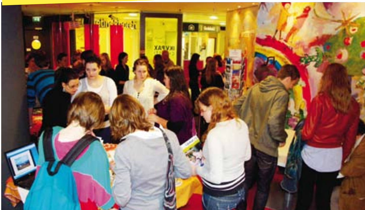
Scholieren tijdens de Informatiemarkt Wereldvrijwilligers

Na de middagpauzedienst zijn bezoekers welkom in de ont-