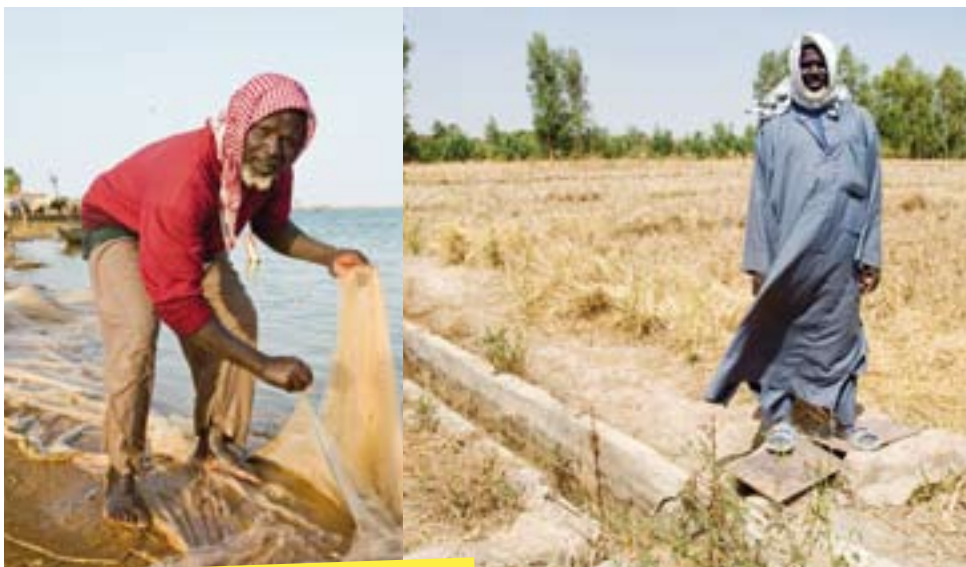
Boukadali als visser en als rijstverbouwer