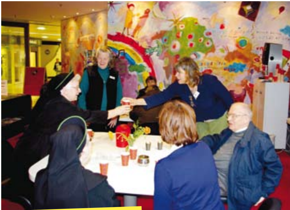
Aan de koffie in de ontmoetingsruimte

moetingsruimte. Van maandag tot en met vrijdag is daar elke middag de gelegenheid voor ontmoeting en gesprek met medewerkers van het Stiltecentrum. De vaste bezoekers zijn meestal eenzame ouderen, daklozen en mensen met psychische problemen: allen zeer kwetsbare mensen. De kernwoorden van het centrum zijn: luisteren, aanwezig zijn, aandacht geven. Het gaat niet om het bieden van oplossingen. Bij concrete hulpvragen wordt er doorverwezen naar een pastor, predikant of hulpverlener.'