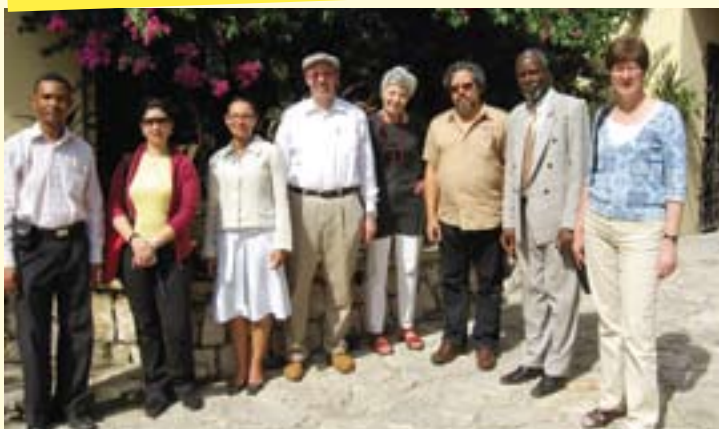
De delegatie in gezelschap van leden van de Protestantse Federatie van Haïti