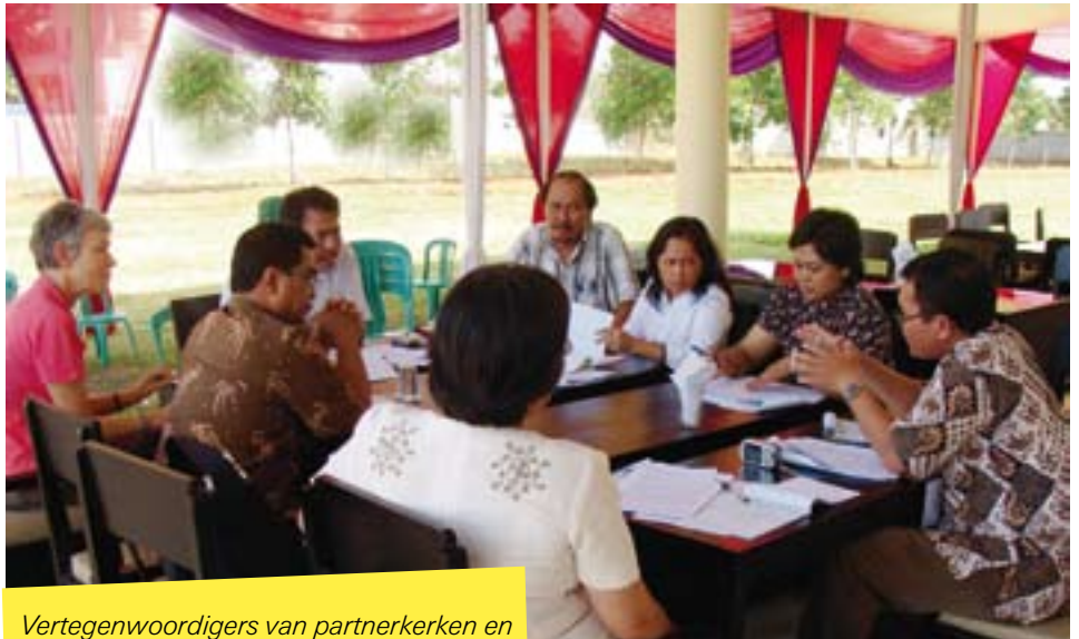
Vertegenwoordigers van partnerkerken en -organisaties wisselen ervaringen uit.