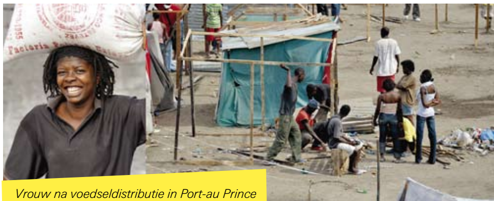
Vrouw na voedseldistributie in Port-au Prince