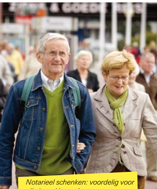
Notarieel schenken: voordelig voor alle betrokkenen!