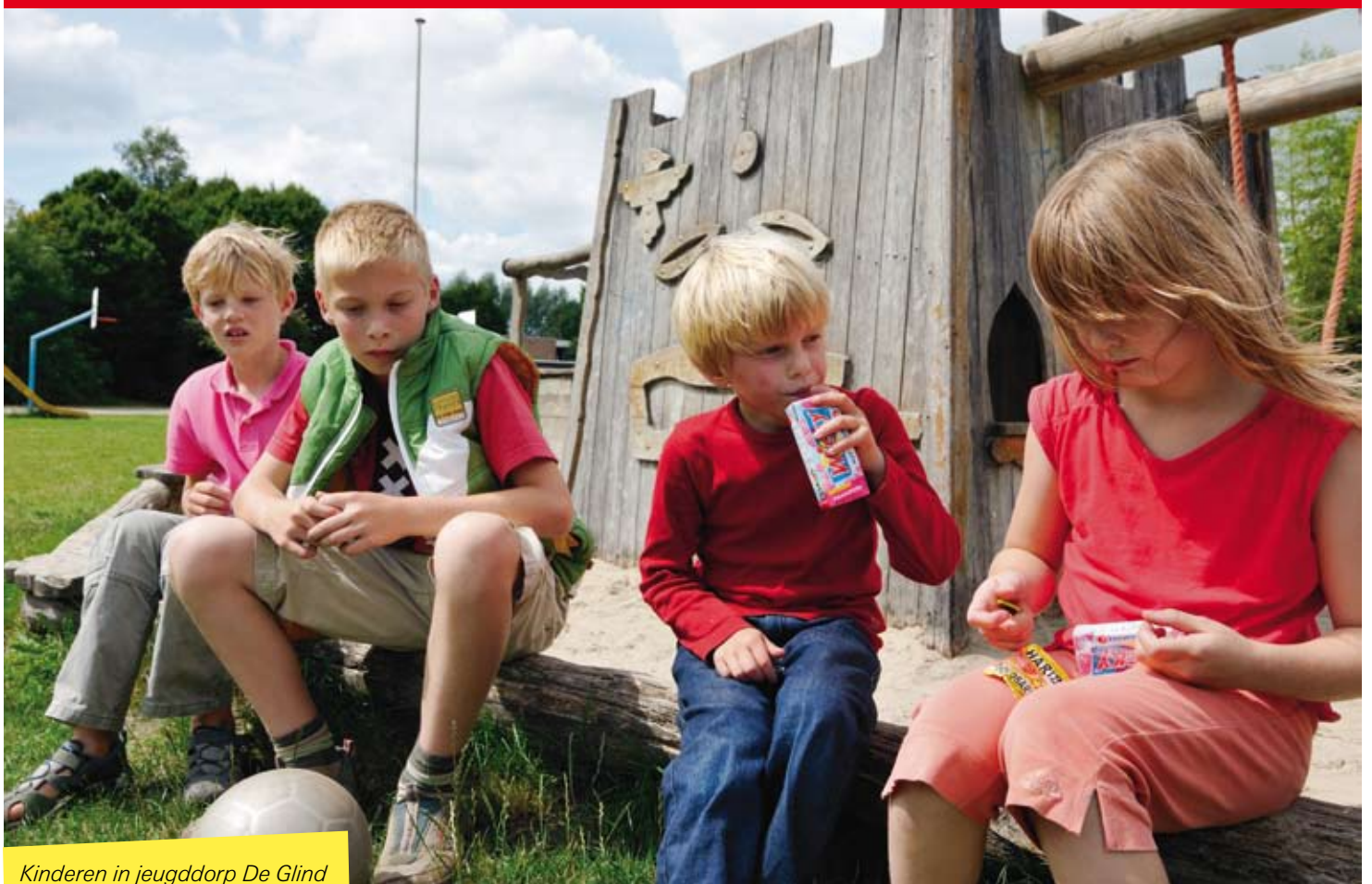
Kinderen in jeugdorp De Glind

hoog in, met een ambitieuze doelstelling: in tien jaar tijd verruilen tienduizend kinderen in Nederland een tehuis voor een gezinshuis!