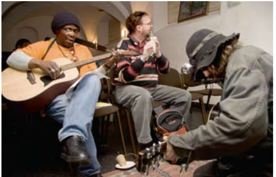
MUZIEK MAKEN NA EEN VIERING ▲

'Op verschillende manieren proberen we die te geven. Zo is er elke zondagmiddag een viering in de drugspost in Amsterdam-Zuidoost en in – wat wij noemen – De Crypte: de korpssaal van het Leger des Heils. Er komen zo'n twintig à dertig mensen. De bezoekers zijn meestal bekend met de kerk, maar ze zijn ervan vervreemd geraakt. Soms omdat ze zich schamen, ook voor God, voor wat ze in het verleden gedaan