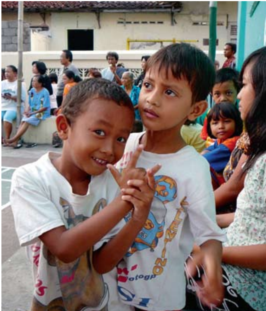
KINDEREN VOOR WIE ANAK WAYANG RUIJTE SCHEPT