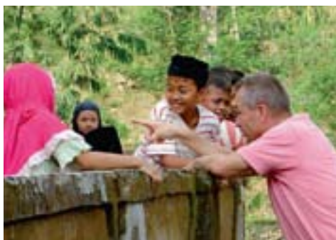
MOOI MOMENT: KINDEREN MET VERSCHILLENDE GELOVEN

Indonesië is het grootste moslimland ter wereld en kent daarnaast christenen, hindoes en boeddhisten. Met elkaar in harmonie leven lukt in veel gevallen, al zijn er helaas nog regelmatig botsingen tussen de fundamentalistische moslims en de christenminderheid. Toch heb ik juist tijdens onze reis ervaren dat er vanuit het christendom veel gebeurt voor andere geloven, simpelweg omdat mensen met elkaar willen samenleven. Het woord zending