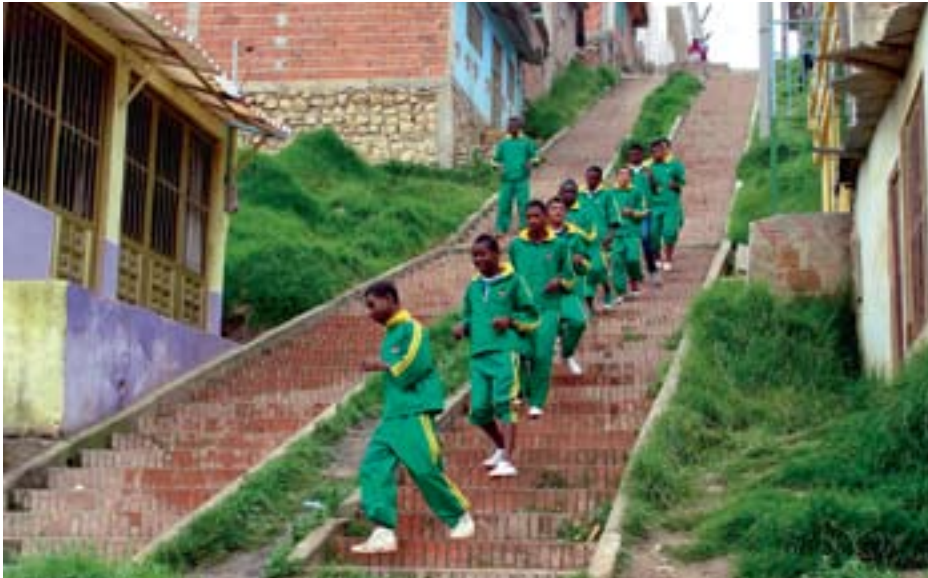
▲ CONDITIETRAINING VOOR JONGEREN

torent er bovenuit. Er wonen vooral vluchtelingen. Er zijn nauwelijks bomen. De ongeasfalteerde wegen veranderen na een regenbui zo in een modderpoel. De sloppenwijken vormen een stad op zich met winkels en gammele bussen die over de kuilen schommelen. Aan de ene kant proef je de armoede, aan de andere kant zie je het dagelijks leven van giebelende meiden, mensen met mobieltjes, en een kind dat geniet van een zak chips.