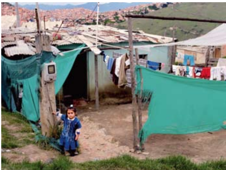
▲ SLOPPENWIJKEN VAN BOGOTÁ

De sloppenwijken zijn tegen de hellingen van Bogotá aangebouwd. Daar wonen 1,3 miljoen mensen. Hutjemutje op elkaar in huizen van steen en golfplaten met plastic watertanks op het dak. Het gebouwtje van de vluchtelingenorganisatie UNHCR