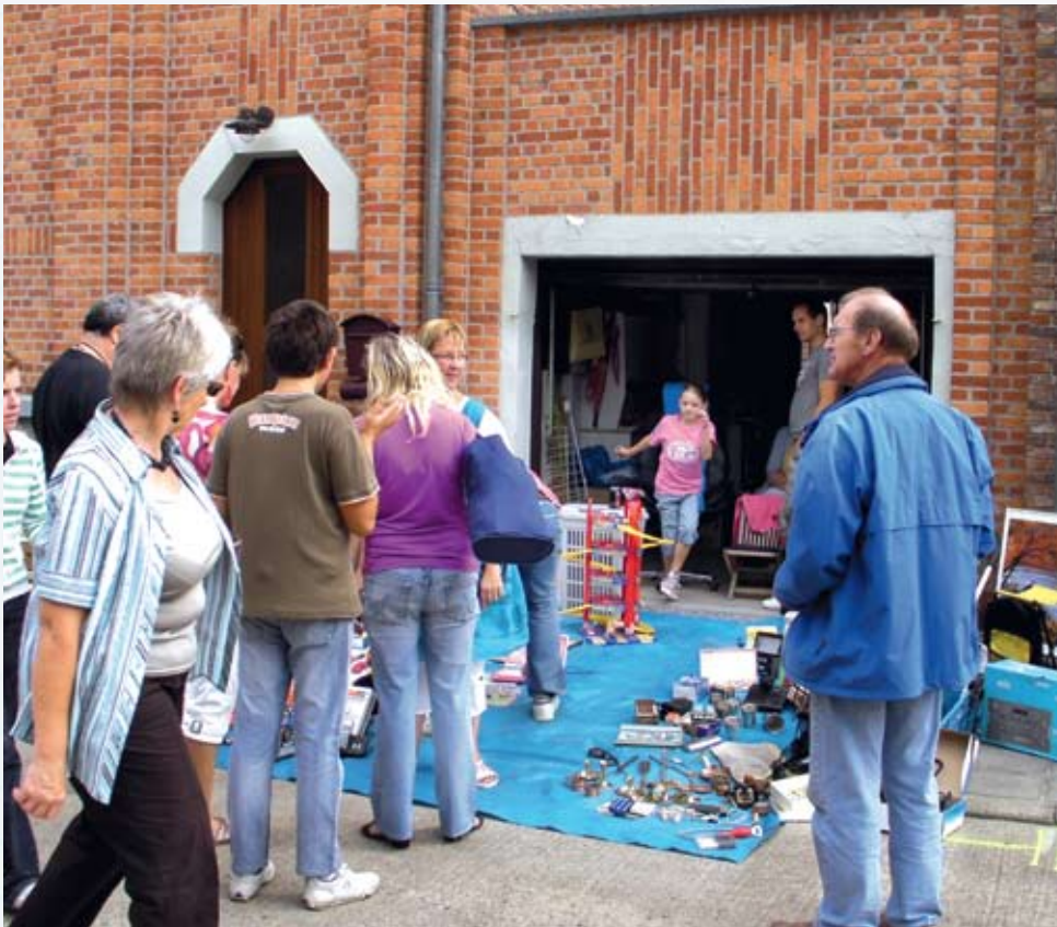
▲ Aan een rommelmarkt willen gemeenteleden vaak wel meewerken. Het is bovendien samenbindend

Eén plus één is meer dan twee. Samenwerken kost overleg, maar het levert ook altijd iets op: zo kun je taken verdelen, deskundigheid en ervaringen delen. Een diaken