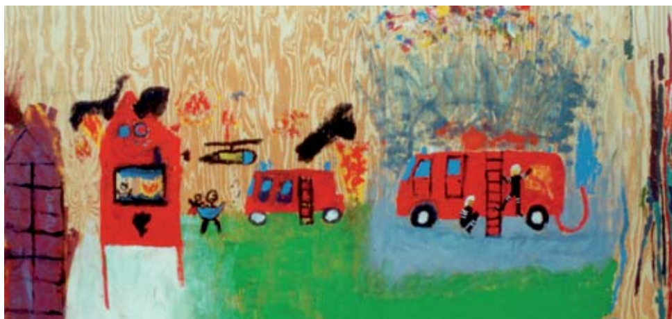
➤ Beschilderde schutting om de wijk Roombeek in Enschede. De kerken waren betrokken bij de nazorg na de vuurwerkramp.

Jan Willem Menkveld j.menkveld@kerkinactie.nl (030) 880 15 30