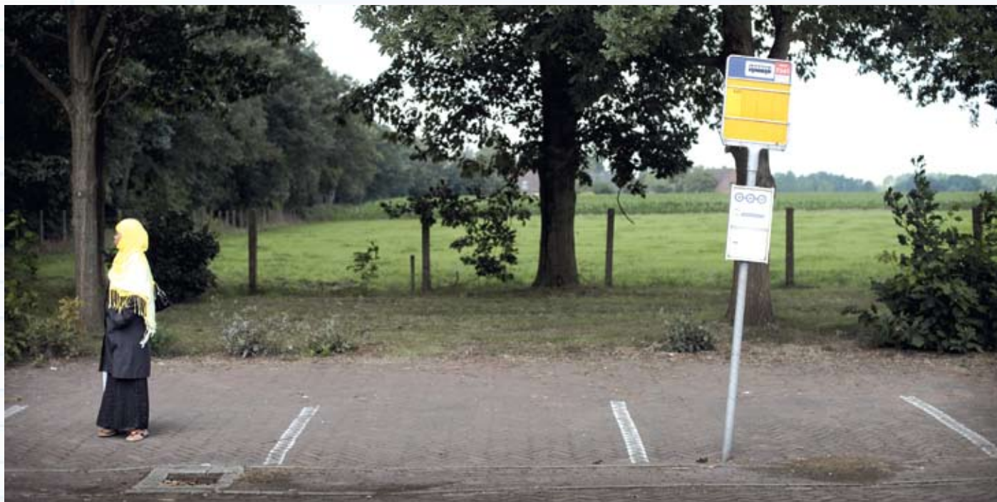
▲ Mensen die hulp nodig hebben kunnen soms op je pad komen, bijvoorbeeld bij een bushalte.