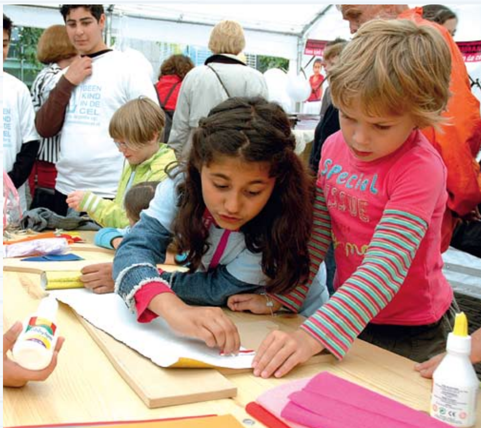
➤ Organiseer eens een feestmiddag voor kinderen uit het asielzoekerscentrum.

De diaconie is er niet om alle problemen op te lossen. Gelukkig zijn er veel organisaties die dat doen. Je kunt mensen goed helpen als je hen goed kan doorverwijzen, maar dan moet je wel op de hoogte zijn. Het spaart je tijd en energie als je goed weet hoe anderen mensen kunnen helpen en ondersteunen. Daarnaast kun je natuurlijk samenwerking zoeken met andere organisaties: VluchtelingenWerk, Voedselbank, Steun-