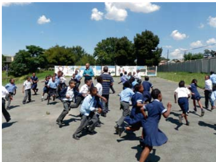
◀ Conquest for Life vangt jongeren uit achterstandswijken op. • Foto: Kerk in Actie

“We hebben ook gekeken of er meer gemeenten in Nederland zijn die Zuid-Afrika steunen, maar het bleek niet reëel om daar ook nog mee samen te werken”, zegt Frits. “We hebben al de lijntjes naar de twee andere gemeenten, de lijnen binnen onze eigen kerk, de lijn naar Kerk in Actie en uiteraard de lijn naar de drie projecten in Zuid-Afrika. Nog meer lijntjes zou te veel worden. We hebben het er ook over gehad om de drie projecten te laten rouleren over de drie gemeenten, maar ook daar zijn we van afgestapt. Want voordat je echt iets opgebouwd hebt, is het jaar alweer om. Elke gemeente steunt daarom alle drie de projecten.”