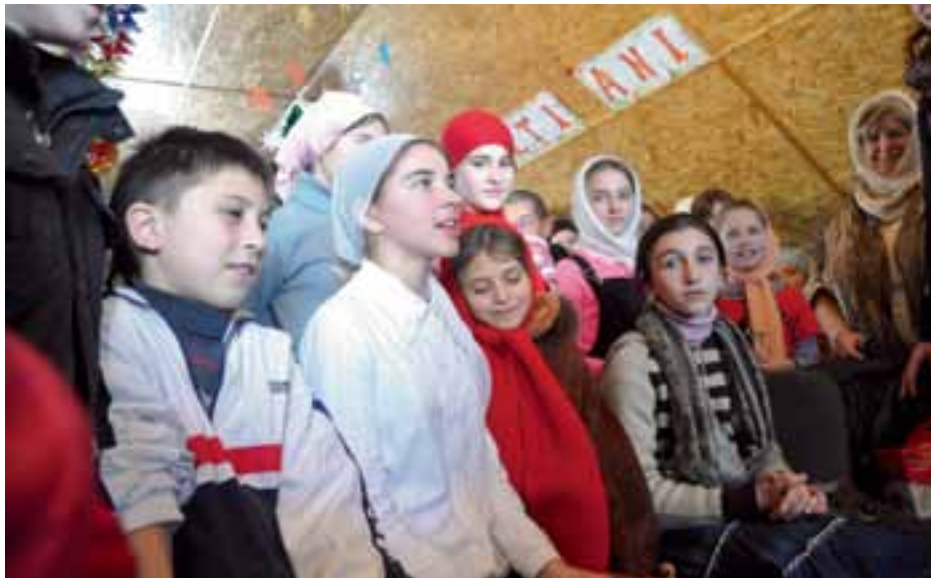
▲ SOCIALE OPVANG KINDEREN