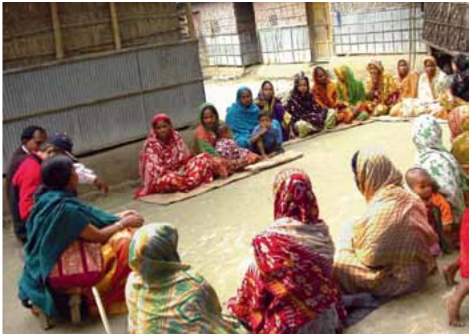
▲ BIJENKOMST VAN EEN ZELFHULPGROEP

Het huidige project van het UST wordt uitgevoerd in de districten Nilphamari en Gaibandha. Deze gebieden worden, mede door de klimaatverandering, vaak getroffen door natuurrampen. In combinatie met de overbevolking leidt dit ertoe dat deze gebieden tot de armste districten van Bangladesh