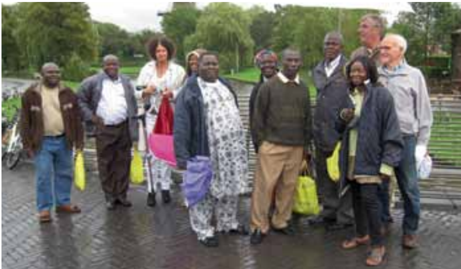
▲ BEZOEK DELEGATIE UIT NIGERIA AAN CLASSIS KATWIJK

De acht Nigerianen kregen een vol programma: Een ontvangst op het gemeentehuis en een bezoek aan de sociale dienst, een bezoek aan een verpleeghuis, een rondleiding door scholen, een ontmoeting met een vrouwenorganisatie en een bezoek aan diaconaal centrum De Bakkerij in