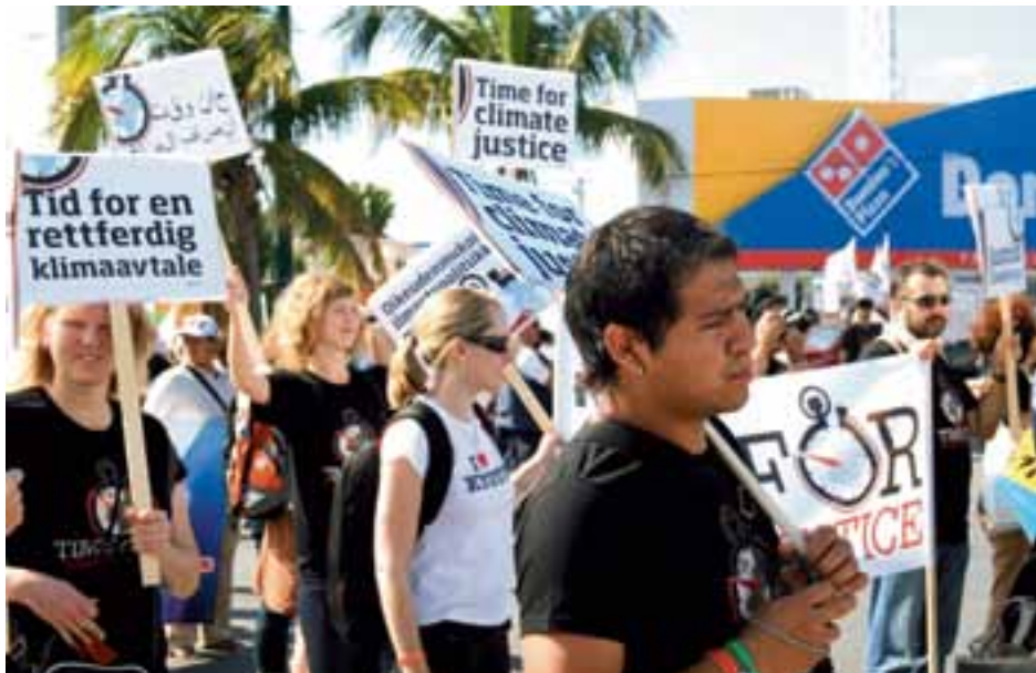
KLIMAATMARS IN CUNCUN ▲

De in Cancun aanwezige politieke leiders waren zich gelukkig wel degelijk