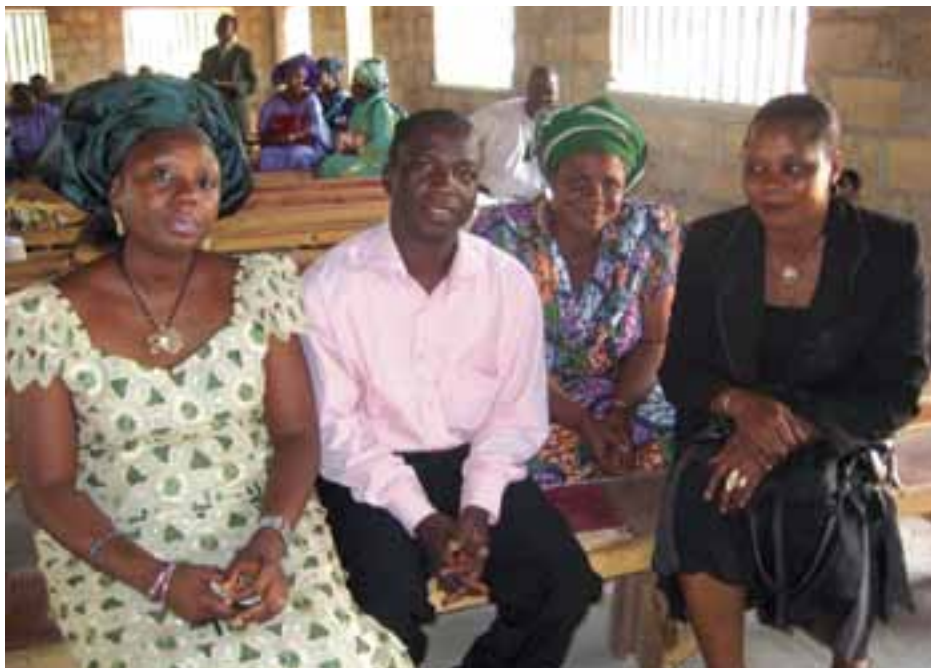
KERKLEDEN IN NIGERIA ▲

Bijzonder was het bezoek aan de laagdrempelige 'boekdienst' met gospelband in Rijnsburg, waar veel jeugd op afkwam. Juist die ontmoeting met jongeren hebben de Nigerianen zeer gewaardeerd en als inspirerend ervaren. Andersom werkte de swingende koorzang van de Nigerianen aanstekelijk voor de 'stijve' Nederlanders. Ook bezochten de Nigerianen een rooms-katholieke dienst van de parochie die bijgedragen had aan het waterpompproject.