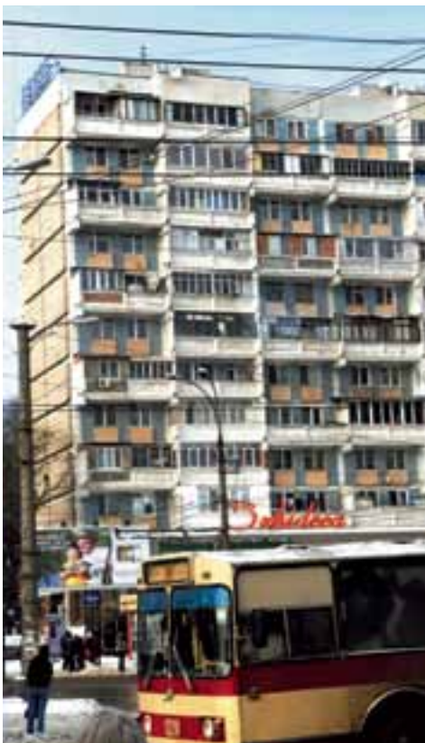
▲ STRAATBEELD MOLDAVIË

Een impressie van deze jongerenreis en van een project in Rotterdam dat eveneens steun verleent aan jonge alleenstaande moeders.