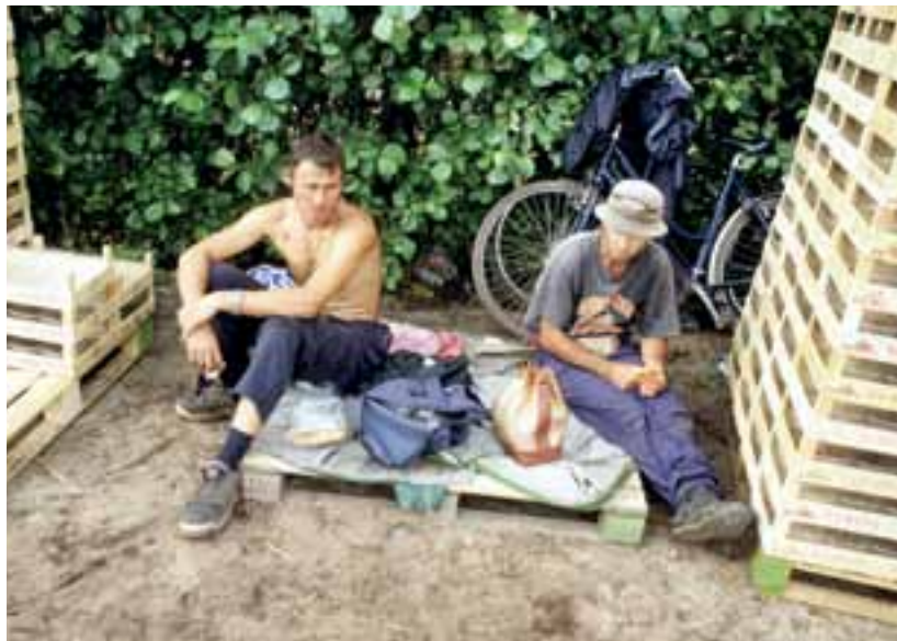
▲ Malafide bedrijven kunnen de situatie makkelijk misbruiken door 'illegale migranten' onder te betalen. • Foto: Piet den Blanken/ HH

Om het tij te keren is Kerk in Actie vorig jaar in gesprek gegaan met een groeiend aantal maatschappelijke organisaties. Daardoor is een brede coalitie tot stand gekomen van organisaties die zich verzetten tegen de strafbaarstelling van illegaal verblijf. Het gaat om heel verschillende organisaties, zoals de vakbonden FNV en CNV, de Raad van Kerken in Nederland, gemeentebesturen en kinderrechten- en migrantenorganisaties. Deze organisaties hebben gezamenlijk een breed draagvlak in de samenleving. In de dagelijkse praktijk voorzien ze allen grote problemen als de kabinetsplannen op dit terrein zouden worden doorgevoerd. Het zou daardoor immers strafbaar kunnen worden om iets voor een uitgeprocedeerde asielzoeker te doen. Bijvoorbeeld als een vakbond juridische bijstand wil verlenen bij het oplossen van arbeidsconflicten. Als die vorm van juridische hulp niet meer zal kunnen worden verleend, leidt dat