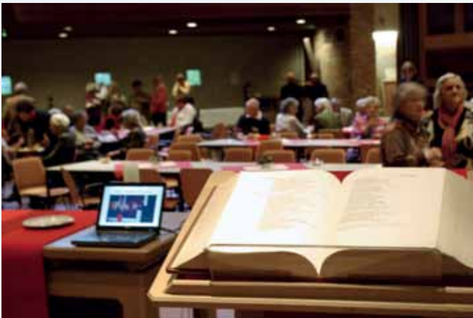
▲ Een (bijbel)tekst of gebed kan inspireren.

Bij de diaconale inzameling gaat het niet alleen om het geld. Het gaat om een mens of om een groep mensen voor wie het bestemd is. De inzameling gaat vaak meer leven als je weet voor wie het is, als je er een gezicht bij hebt. Dat kan niet altijd letterlijk, omdat het praktisch niet haalbaar is. Dan moet je het van schriftelijke informatie hebben. Als het wel mogelijk is, kun je met een groep gemeenteleden of als diaken zo'n bestemming eens bezoeken en in de dienst vertellen wat je in die ontmoeting geraakt heeft.