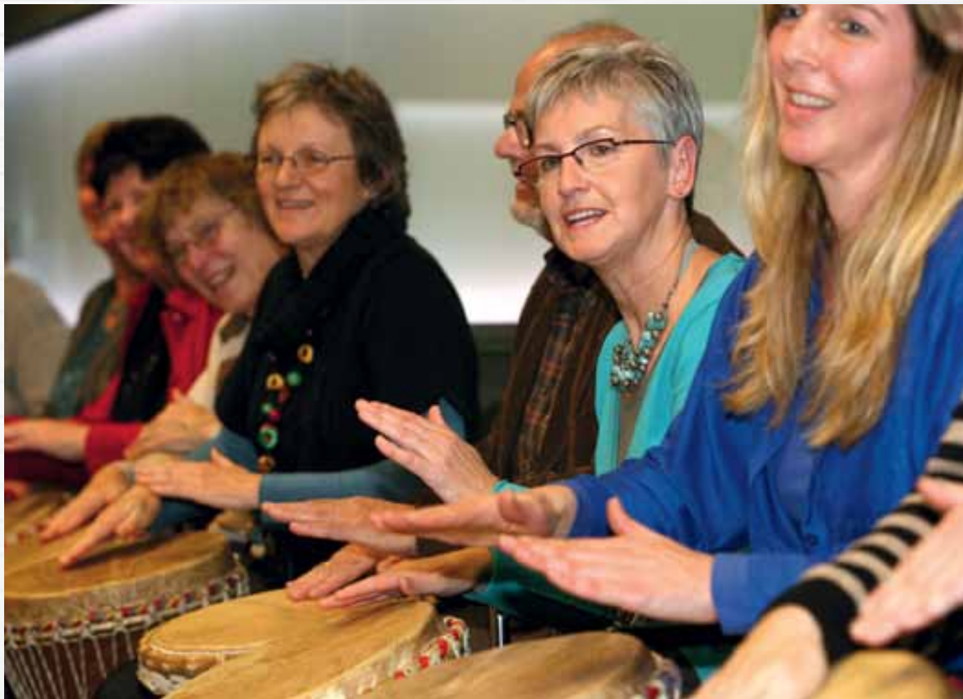
▲ Tijdens een workshop op de Landelijke Diaconale Dag kunnen diaconen elkaar inspireren. • Foto: Jaap de Jager