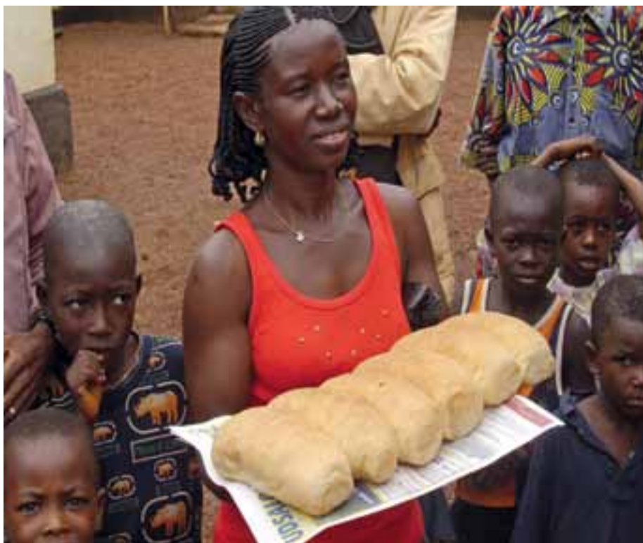
▲ Kinderen in Sierra Leone zijn een bakkerijtje gestart, met Kerk in Actie-hulp uit Vleuten, De Meern en Leidsche Rijn-oost.

De Talent Winterfair kwam op gang na een bevolgen presentatie door de diakenen en de zwo'ers binnen de kerken. Aanvankelijk was niet iedereen overtuigd, maar toch gingen de schouders eronder. Binnen de kerken werd gezocht en gekeken naar mensen met een talent. De een kon een trui breien, de ander een schilderij maken. Van het een kwam het ander en burens vroegen burens en vrienden vroegen vrienden. Uiteindelijk waren er ongeveer honderd aanmeldingen om mee te werken.