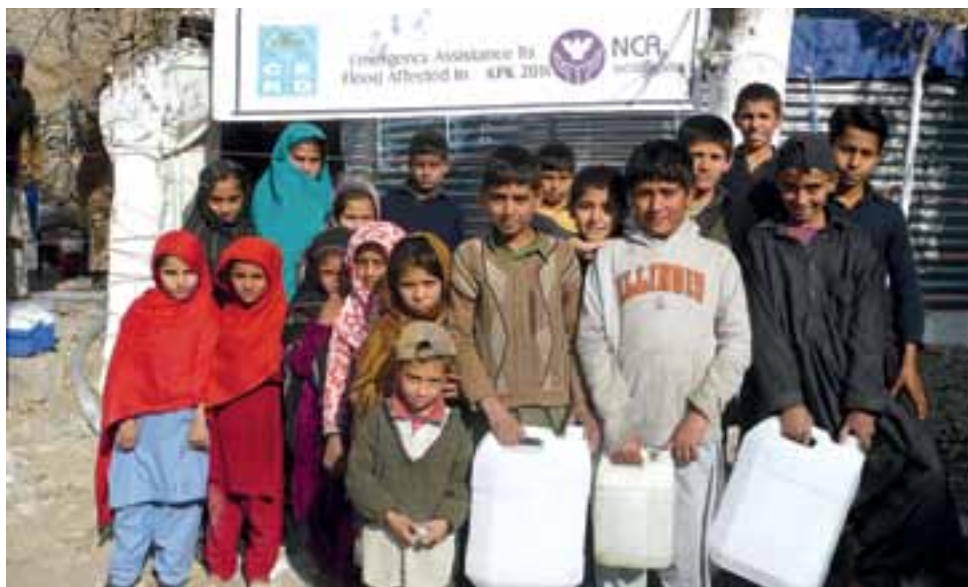
➤ Kinderen in Toda Chena bij de waterzuiveringsinstallatie.

In een dorp verderop stoppen we bij wat bijna een fata morgana