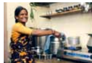
▲ Koken op biogas in India: mogelijk gemaakt door het FairClimate-programma van Kerk in Actie.

In het februarinummer van Diakonia stond op pagina 7 als fotograaf vermeld Maileen Kruidenier D&DJ. Dit moest zijn: Bärbel Goedeling (wijkpastoraat Oude Noorden Rotterdam).