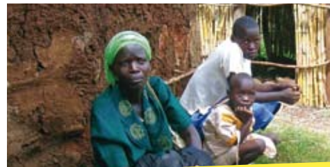
ICCO en Kerk in Actie konden in Kenia de vluchtelingen in de kampen voorzien van de eerste levensbehoeften.