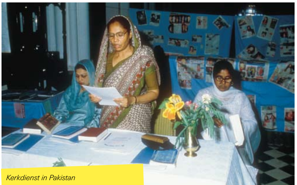
Kerkdienst in Pakistan

'Christenen hebben van oorsprong een culturele achterstand en worden gezien als tweederangsburgers. Moslims beschouwen christenen als een overblijfsel van de Engelse overheersing. Ze zien hen als niet-