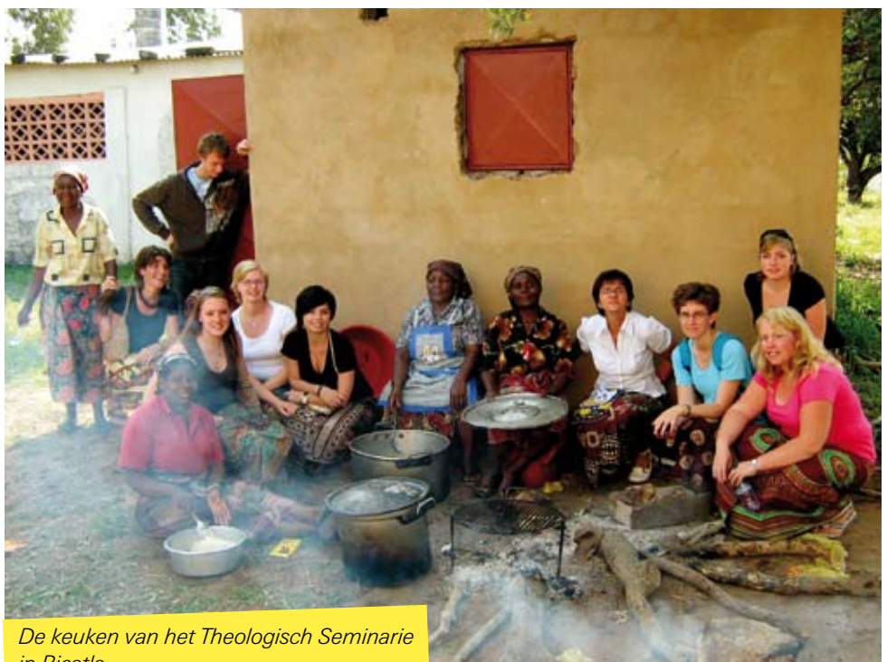
De keuken van het Theologisch Seminarie in Ricatla

De reis heeft een gigantische indruk op ons gemaakt. Mozambique is een land dat zo anders is dan ons eigen land, en ook zo anders dan een vakantieland waar we gewoonlijk naartoe gaan. We hebben verschillende bezoeken afgelegd aan gemeenten, projecten en dorpen. We werden hartelijk ontvangen met zang en dans. De armoede was overal aanwezig. De Mozambicanen hebben over het algemeen een zwaar leven. Op straat zie je veel men-