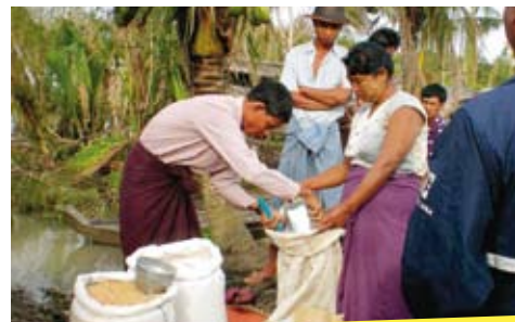
Na de cycloon Nargis, die in mei van dit jaar een spoor van doden en verwoestingen achterliet in Myanmar (Birma), kunnen nu plannen worden gemaakt voor de wederopbouw.

ACT International ( www.act-intl.org ) coördineert de hulpverlening van kerkelijke organisaties, waaronder ICCO en Kerk in Actie, om samen noodsituaties aan te pakken. Zo ondersteunen ICCO en Kerk in Actie programma's om organisaties sterker te maken, om mensen voor te bereiden op aardbevingen en overstromingen, maar ook om hen te helpen minder kwetsbaar te zijn. Dat kan bijvoorbeeld door inkomen 'duurzaam' te maken: niet afhankelijk van één inkomensbron (bijvoorbeeld niet alleen verbouw van gewassen, maar ook veeteelt of handel). Bij regeringen kaarten ICCO en Kerk in Actie onrecht aan. Daarnaast leiden zij mensen op om problemen individueel of gezamenlijk aan te pakken. Als een ramp leidt tot een nationale geldinzamelingsactie, werken ICCO en Kerk in Actie onder de paraplu van de Samenwerkende Hulporganisaties ( www.giro555.nl ). Dat doet Kerk in Actie sinds de oprichting in 1989. Van een nationale actie ontvangt Kerk in Actie een deel van de opbrengst om via haar partnerorganisaties ter plekke te besteden.