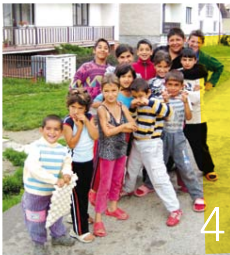
Foto omslag: Regenboogdans, Theatergroep Cards (zie p. 12).