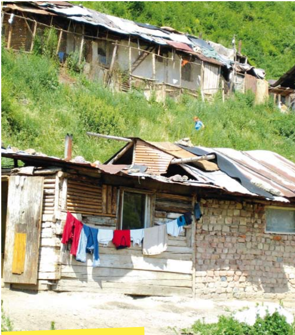
Huizen in een Romakamp in Slowakije.