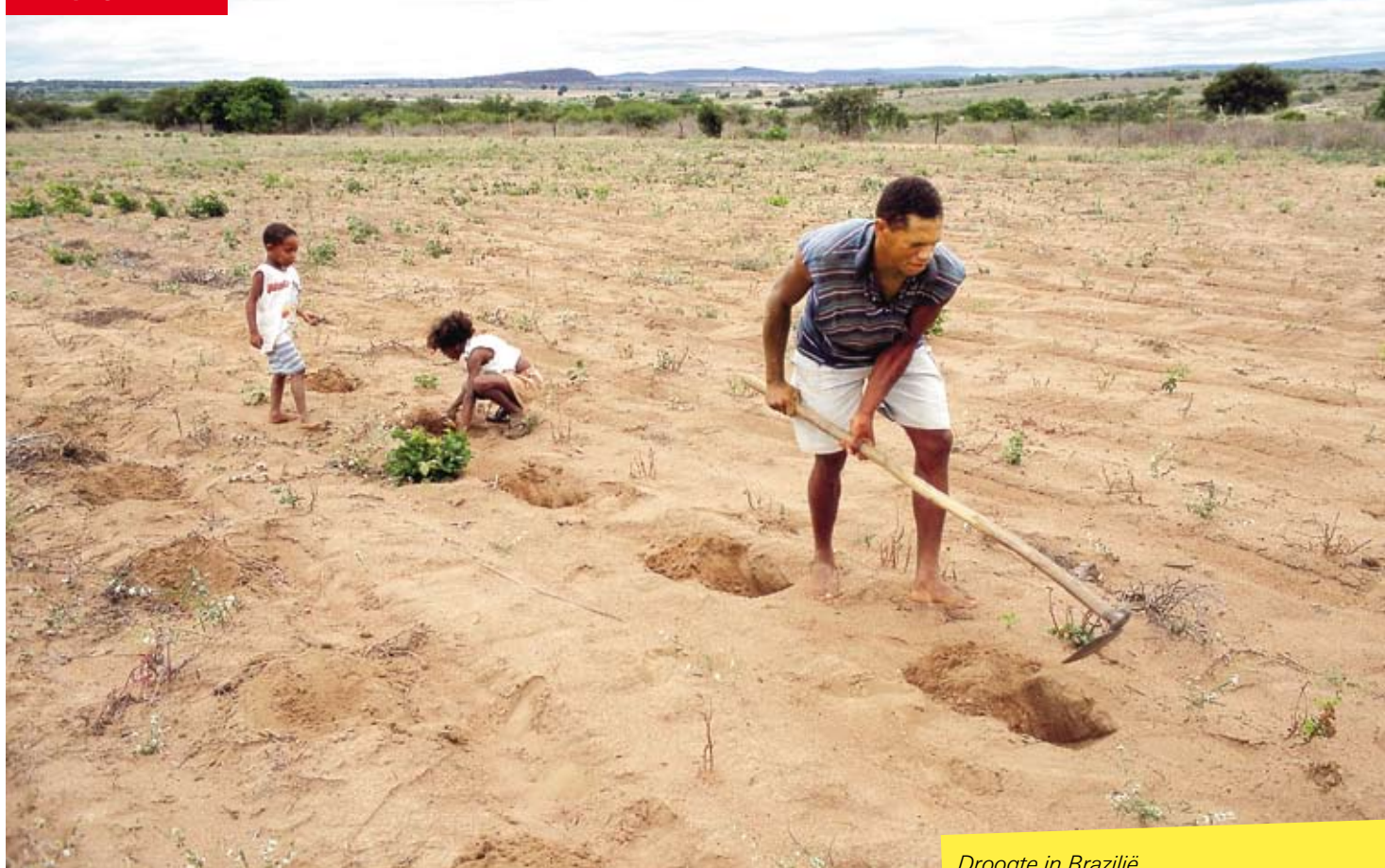
Droogte in Brazilië.