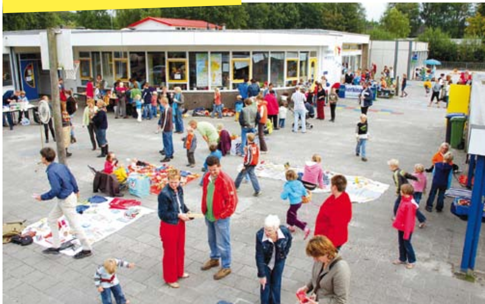
Speelgoedmarkt in Beetsterzwaag.

Soms haakt de werkgroep aan bij een reeds bestaande activiteit. Een voorbeeld hiervan is de speelgoedmarkt die de christelijke basisschool De Paedwizer in Beetsterzwaag elk jaar organiseert. In 2007 ging de gehele opbrengst naar Nicaragua. De braderieën en rommelmarkten in het dorp bieden een ander voorbeeld. De werkgroep schiept de mogelijkheid dat gemeenteleden allerhande spulletjes verkopen. Ook hiervan gaat de opbrengst naar Nicaragua.