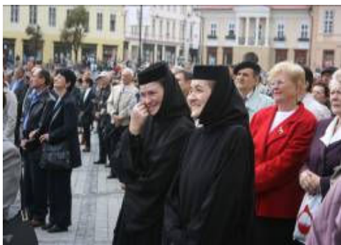
Roemeense orthodoxe nonnen bij de slotviering van de 3e Oecumenische Assemblee

en hopelijk dan ook te zorgen voor elkaar. De volgende assemblee is waarschijnlijk over 10 jaar, misschien kunnen we alvast gaan oefenen. En dat we dan samen dat mogen doen en ervaren, wat Jezus Zelf aangegeven heeft: God liefhebben met geheel ons hart, verstand en kracht en onze naaste als onszelf. Dat we niet meer zelf of onze kerk in het middelpunt willen hebben, maar God en onze naaste. Soms waren die momenten er al, ik heb mooie herinneringen aan bepaalde gesprekken of delen van vieringen. God brengt ook mensen bij elkaar om samen Hem te dienen en samen te zorgen voor elkaar en anderen.