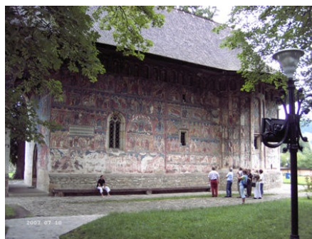
beschilderde klooster uit Roemeens Moldavië

Het was bijzonder om elke ochtend met honderden Christenen uit tientallen landen een dienst te hebben. De ene keer zat je aan tafel met mensen van het Leger des Heils uit Engeland, een andere keer met een Italiaanse priester en een Oekraïense Orthodoxe schrijver, een ambtenaar van het Roemeense ministerie, een Hongaarse bisschop of iemand uit de Noorse Orthodoxe kerk. Er waren hele goede ontmoetingen, waarin je de eenheid ervoer die er zou moeten zijn tussen Christenen. Soms bleek, dat je allemaal met dezelfde vragen bezig was, bijvoorbeeld rond jeugdwerk of de eenheid van kerken in je land. Op sommige momenten kwam naar voren dat de eenheid nog ver te zoeken is. Dat er weinig aandacht leek te zijn voor bijv. minderheidskerken of migrantenkerken. Dat erover gerechtigheid en zorg voor elkaar gesproken werd, maar er geen aandacht was of gepraat werd met de mensen om wie het ging.