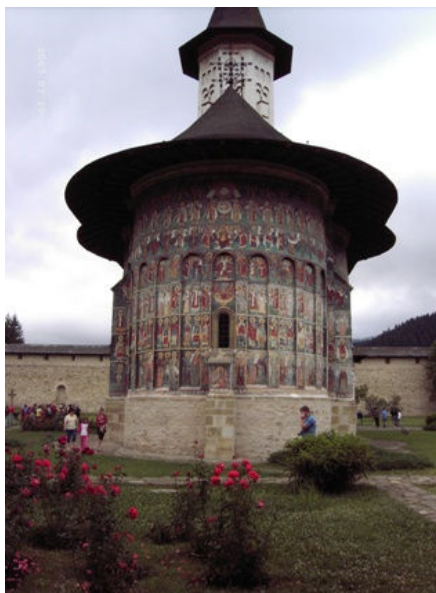
beschilderde klooster uit Roemeens Moldavie

Zelf ben ik bezig om me steeds verder te verdiepen in de Roemeense Orthodoxe theologie. Uiteraard weet ik aardig wat, omdat ik hier al een tijd ben. Maar het valt me op, dat hoe meer ik weet, ik ook steeds meer nieuwe vragen krijg. Elke keer ontdek ik weer wat nieuws. Het is een totaal andere wereld en theologie dan de West-Europese. Je merkt het al, als je een kerk binnenloopt: de mooie schilderijen met Bijbelse taferelen en met heiligen van onder tot boven op alle muren en plafonds, de geur van wierook, het gezang van de priesters, mensen die even binnenkomen om de icoon te kussen. Liturgische teksten en theologische boeken die teruggrijpen op de oud-kerkelijke tradities.