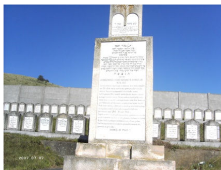
Een Joods kerkhof, zo'n 50 km ten oosten van Cluj

In de oorlog was ook hier de vervolging sterk, Joden werden vermoord of naar kampen gedeporteerd. In 1947 telde het land nog maar 428.000 Joden; bijna de helft van het vroegere aantal.