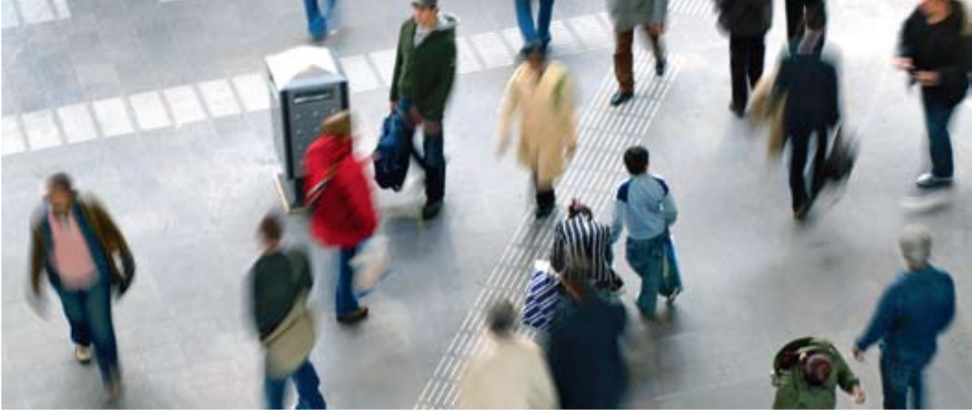
▲ Wie zijn er arm in onze gemeente?

vol met de resultaten, waarover ik een maand heb zitten tobben. Toen herinnerde een van de diakenen zich opeens dat op een van de formulieren een mevrouw zich had gemeld om de resultaten van het onderzoek te verwerken en analyseren, met grafieken en al. En dat is gelukt."