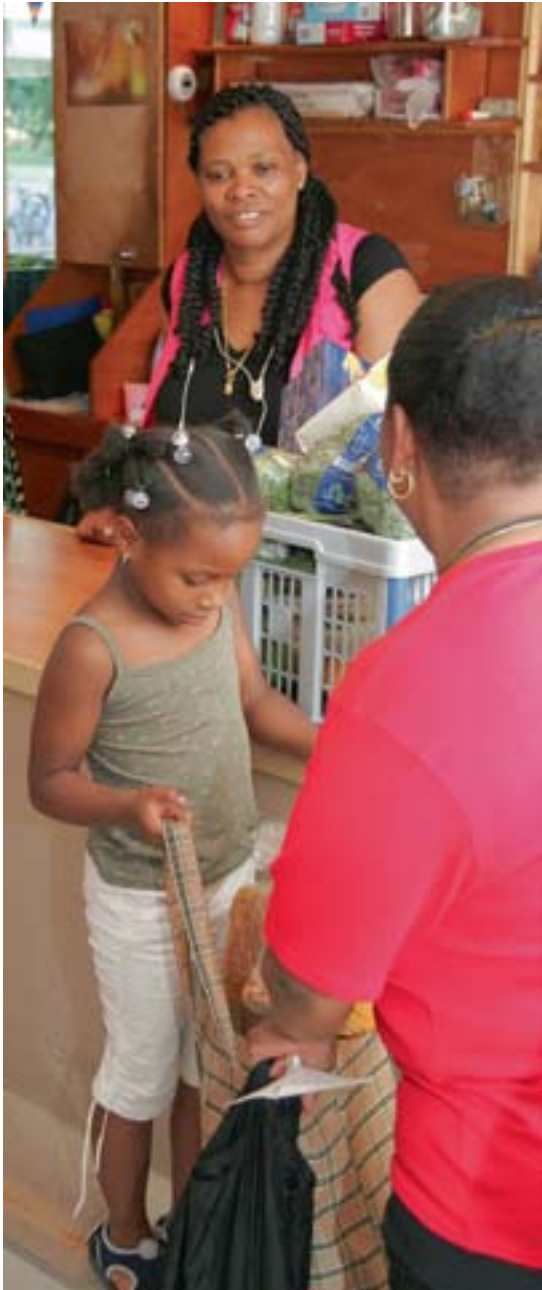
▲ In totaal gaven alle diaconieën samen ruim 12 miljoen euro aan collectieve voorzieningen, zoals voedselbanken en ruilwinkels. • Foto: Gerrit Groeneveld/Kerk in Actie

bezoekers en predikanten of ze alert zijn op situaties die een risico geven op armoede. Een gemeenteadviseur kan gevraagd worden de training 'op bezoek met een diaconale antenne' te geven, zodat men toegerust is over wat armoede in Nederland inhoudt, welke risicogroepen er zijn en welke signalen van belang zijn. Dit leent zich goed voor een interkerkelijk initiatief, want samenwerking met andere kerken is eigenlijk een 'must'. Het biedt kansen voor vast overleg met een wethouder, de beleidsambtenaar of het opzetten van een armoedewerkgroep, sociale alliantie of noodfonds.