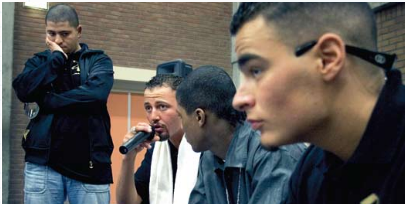
♣ In een jeugdgevangenis. • Foto: Olivier Fourniquet