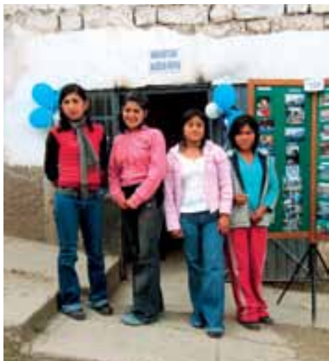
▲ DIENSTMEISJES IN PERU

ICCO en Kerk in Actie maken deel uit van het platform Stop Kinderarbeid (zie: www.stopkinderarbeid.nl ). Ze doen er alles aan om de rechten van kinderen, ook in Peru, te verbeteren, onder andere door er bij overheden op aan te dringen dat kinderen naar school gaan. Lobby naar instanties maakt daar ook deel van uit. ICCO en Kerk in Actie steunen in Peru de organisatie Huñuq Mayu . Deze maakt deel uit van het Kinderen in de Knel programma dat zich in Peru vooral richt op het tegengaan van kinderarbeid.