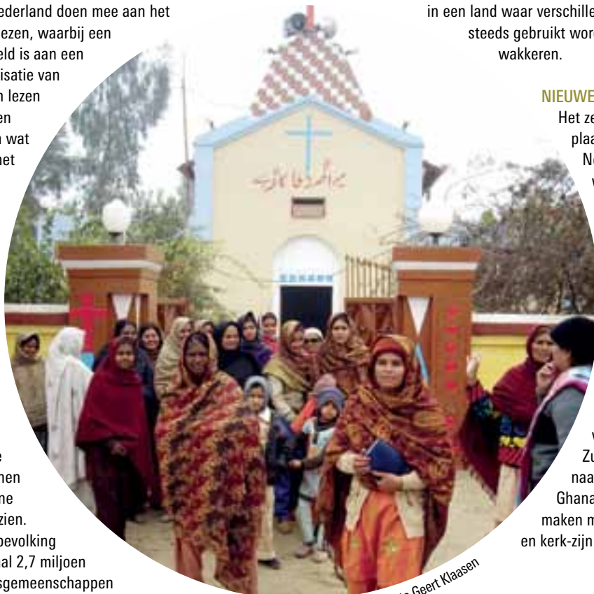
Kerk van Pakistan

Het zendingsprogramma verbindt plaatselijke gemeenten in Nederland met het wereldwijde partnernetwerk van Kerk in Actie. Ter versterking hiervan werden in 2010 drie nieuwe initiatieven gelanceerd: de eerste landelijke zendingdag in april 2010 voor plaatselijke vrijwilligers met als thema 'Geloven over grenzen heen'; het bezoek van vijftien vertegenwoordigers van partnerkerken uit het Zuiden; de inspiratiereizen naar Thailand, Indonesië en Ghana met als doel kennis te maken met andere vormen van geloof en kerk-zijn.