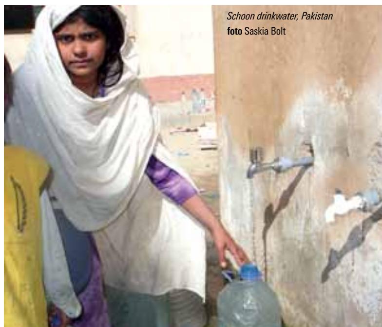
Schoon drinkwater, Pakistan

Op 12 januari 2010 werden Port-au-Prince en de directe omgeving getroffen door een zware aardbeving. Het kantoor dat ICCO en Kerk in Actie in augustus 2009 in Haïti hadden geopend, was door de aardbeving verwoest. Een van onze collega's werd ernstig gewond onder het puin vandaan gehaald. De lokale partners hadden ook veel verliezen geleden. Dit bemoeilijkte in het begin de hulpverlening. Inmiddels is een gemotiveerd team van lokale medewerkers actief. Verschillende projecten zijn gefinancierd via het netwerk van ACT Alliance.