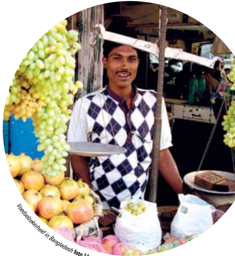
Voedselzekerheid in Bangladesh

Een derde thema is de bevordering van duurzame rechtvaardige economische ontwikkeling.