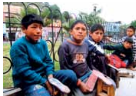
▲ SCHOENPOETSSENDE JONGENS IN EEN PARK IN PERU

Nader kennismaken met Peru? De Missie-Zendingskalender 2012 geeft u een kleine impressie van het leven in Peru. De kalender heeft afbeeldingen van de Peruaanse kunstenaar Jaime Colán. Op pagina 2 in deze Vandaar treft u daar een voorbeeld van. Zie voor de bestelwijze het bericht op pagina 5.