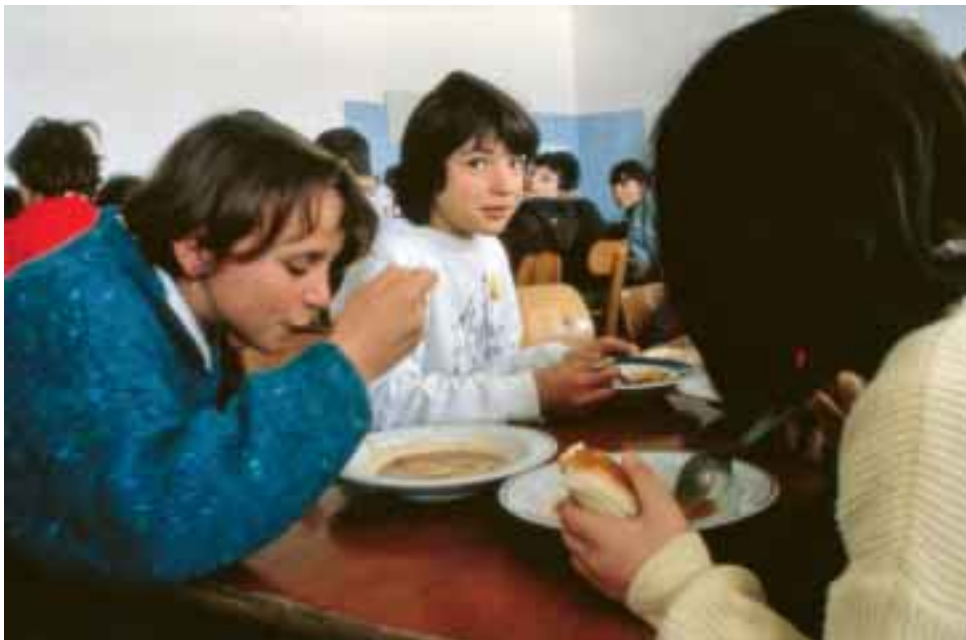
In Bosnië praten jongeren gezamenlijk over hun toekomst.