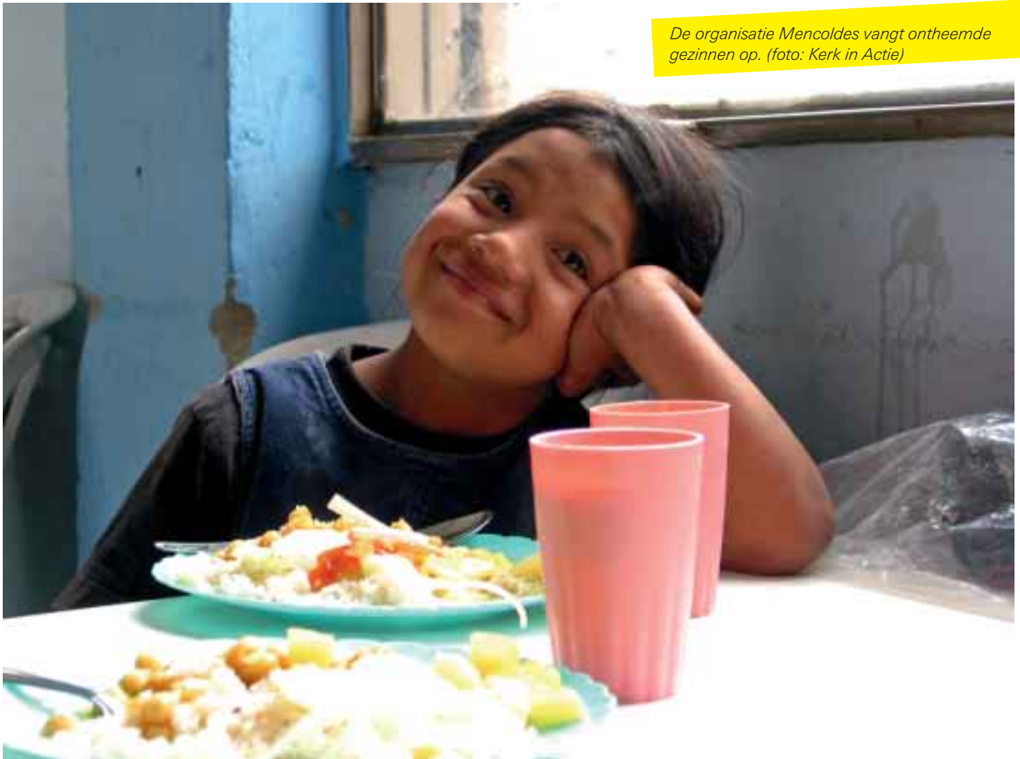
De organisatie Mencoldes vangt ontheemde gezinnen op.

dat te kunnen doen, werkt Mencoldes niet met overheidsgeld. "We willen onze onafhankelijkheid bewaren. De Colombiaanse regering wil een militaire oplossing voor het probleem. Daar geloven wij niet in. Wij geloven dat duurzame vrede pas tot stand kan komen als er economische rechtvaardigheid is."