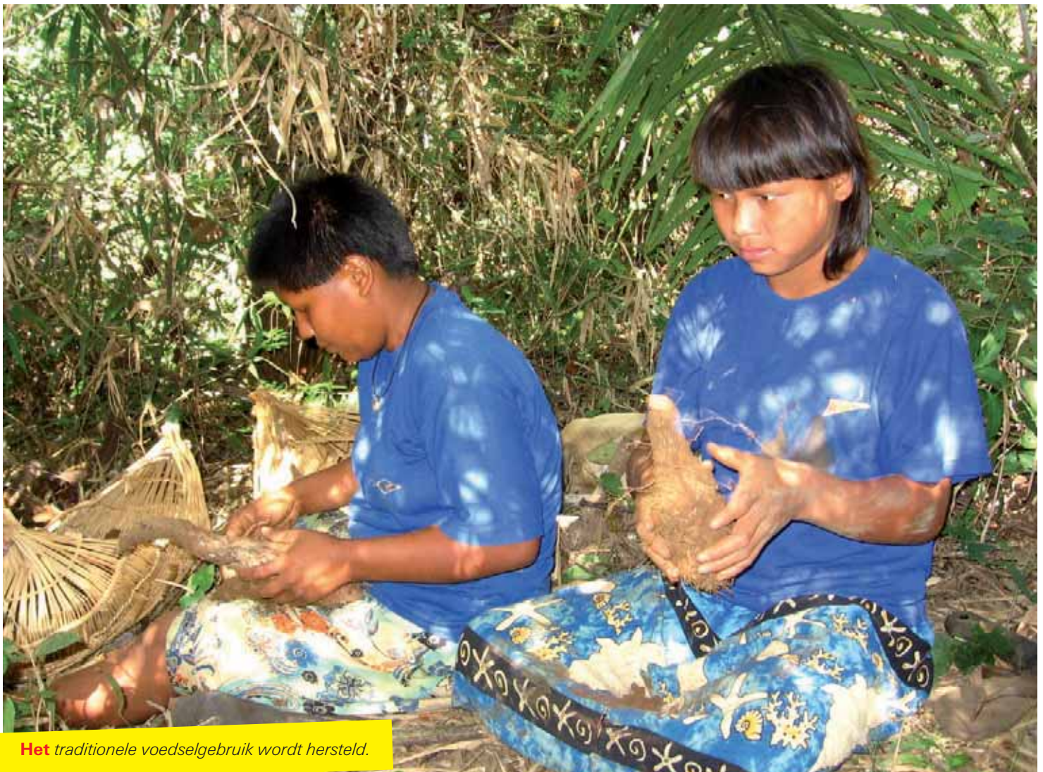
Het traditionele voedselgebruik wordt hersteld.

Inheemse volken hebben de natuur hard nodig voor de jacht en visserij en voor de oogst van wilde planten, vruchten en wortels. Daarnaast heeft de natuur voor hen ook een grote spirituele waarde en levert medicinale planten. Het grootste probleem voor vrijwel alle inheemse volkeren is de dreigende ontbossing van hun reservaten en de veranderende voedselgewoontes. De situatie wordt extra ingewikkeld door de