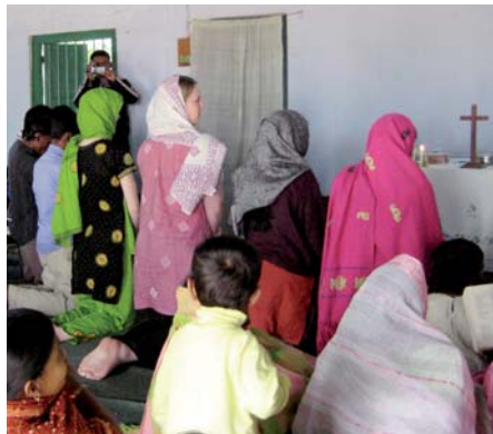
▲ KERKDIENT IN DHAKA

schillende manieren verslag gedaan van hun reis. En in Bangladesh is de reis voor verschillende kerken een stimulans geweest om tot samenwerking te komen.