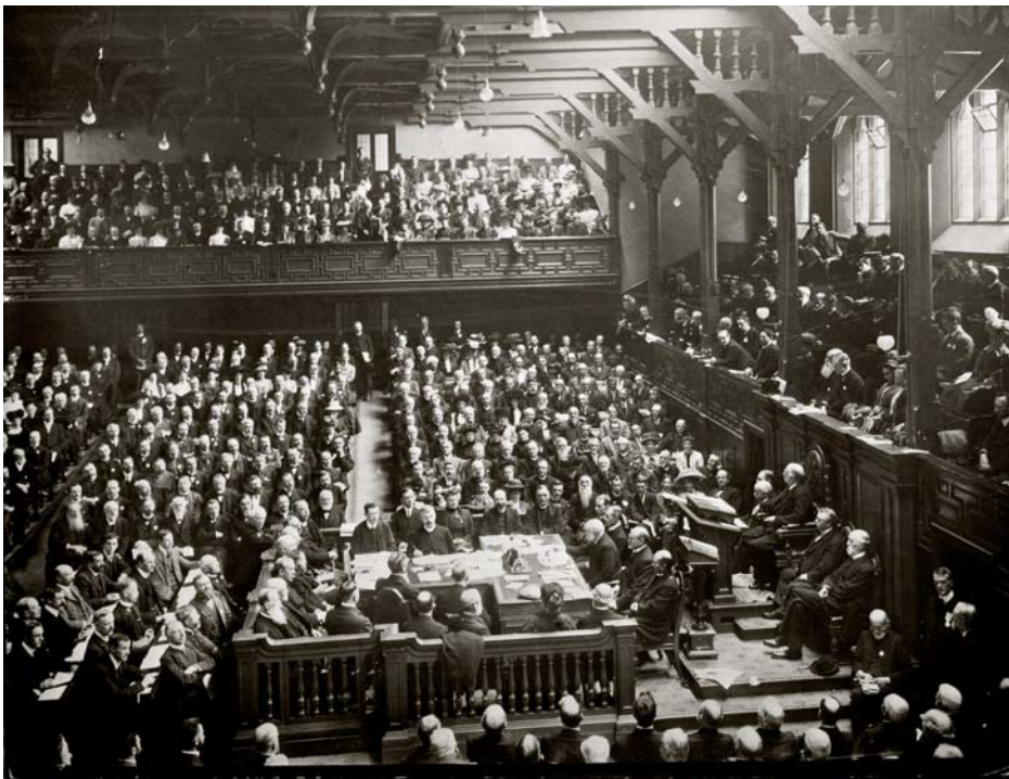
▲ AFSLUITENDE VIERING 1910

Een eeuw na de grote wereldzendingconferentie van 1910 kwamen christenen dit jaar opnieuw bijeen in Edinburgh om zich te beraden op de missionaire opdracht van de kerk. Wat een verschillen met honderd jaar daarvoor. En toch ook weer niet!