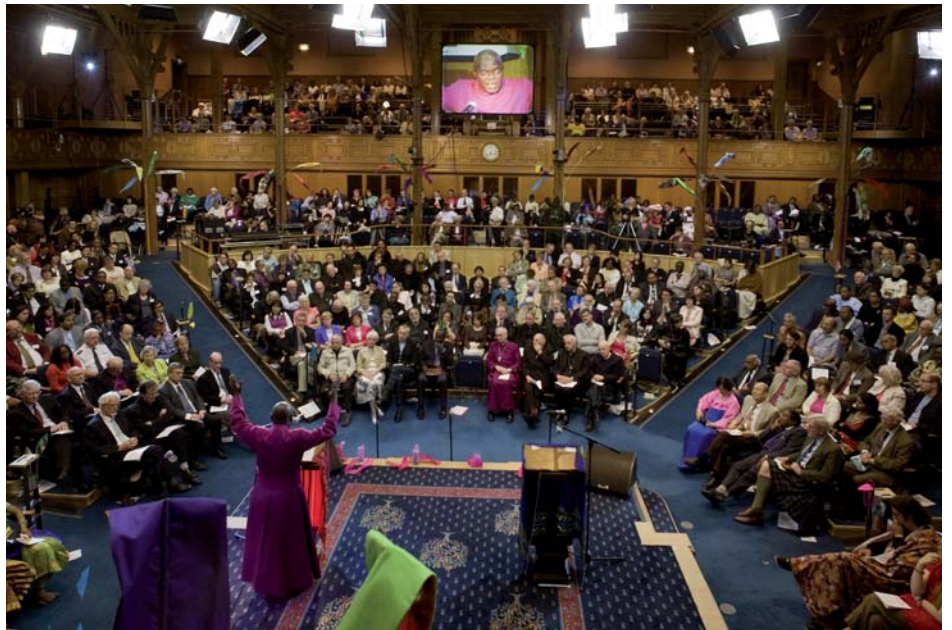
AFSLUITENDE VIERING 2010 ▲

Wereldbond van Gereformeerde en Hervormde Kerken heeft het Gezamenlijk Appel, voorzien van een brief, aan alle lidkerken gestuurd 'om aan jullie door te geven ... wat we gezien en gehoord hebben' (1 Johannes 1: 3).