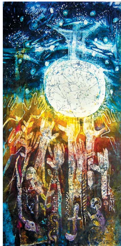
NIEUW LEVEN (AFBEELDING DECEMBERMAAND) ▲ © TONY NWACHUKWU

➤ De Missie-Zendingskalender 2011 is een uitgave van de Nederlandse Zendingsraad en Mensen met een Missie. Met de kalender willen de uitgevers laten zien hoe medechristenen hun geloof in hun samenleving en cultuur ter sprake brengen. Zie ook: www.missiezendingskalender.nl . Kerk in Actie beveelt van harte de kalender bij u aan. Door een kalender te kopen steunt u het werk van Kerk in Actie. De Missie-Zendingskalender 2011 kost € 8, -- wanneer u deze koopt bij de diaconie, zwo- of zendingscommissie in uw gemeente. De kalender is ook via de webwinkel van Kerk in Actie te verkrijgen. Deze kost dan € 12, -- (inclusief verzendkosten). Zie: www.kerkinactie.nl/webwinkel .