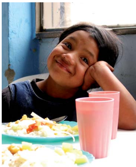
▲ EEN MEISJE GENIET VAN HAAR MAALTIJD IN EEN GAARKEUKEN

Meer dan een miljard mensen zijn chronisch ondervoed. Dat aantal is nog nooit zo hoog geweest. De oplossing begint, wat Kerk in Actie betreft, bij een klein bedrag: 15 cent. Want zo weinig kost een maaltijd voor een kind in een arm land.