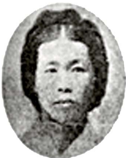
▲ KIM SEJI ROND 1910

De missionaire accenten van de conferentie werden vastgelegd in een Gezamenlijk Appel (zie www.edinburgh2010.org ). Een urgent aspect is de kwestie van machtsrelaties in de zending. Want de idee 'wie betaalt, bepaalt' lijkt nog niet verdwenen en rentmeesters houden zich niet zelden voor eigenaars. De delegatie van de