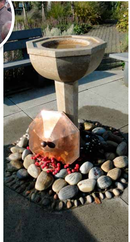
^ 'In de duurzame kloostertuin bij het kerkelijk centrum 'De Ruimte' in Elst is plaatsgemaakt voor het oude doopvont.