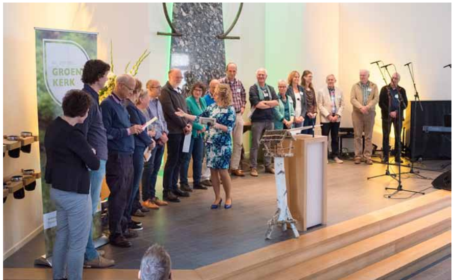
▲ De nieuwe lichtung groene kerken op het podium tijdens de GroeneKerkendag.