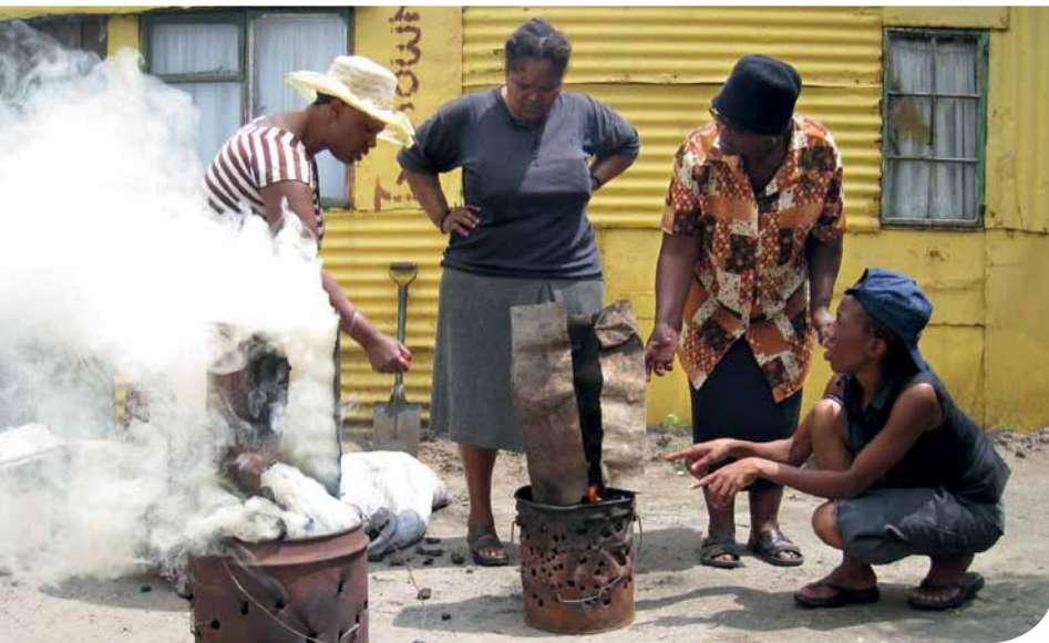
Colmschate steunt het project ‘schoner stoken’ in Zuid-Afrika.

Een voorbeeld van een schonere leefwereld veraf ziet Colmschate heel duidelijk in het Novaproject Basa Magogo. De kerk vraagt zo de aandacht voor milieu-, gezondheids- en armoedeproblematiek in de townships van Zuid-Afrika. Een andere stookwijze levert minder CO 2 uitstoot en rook op. Dat is beter