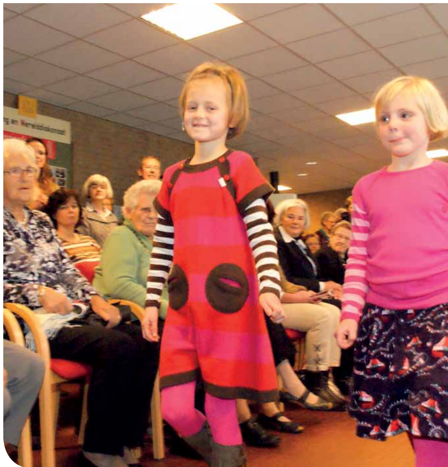
Een fairtrade modeshow in Delft.